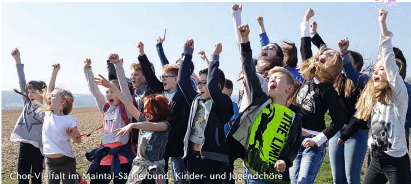
Chor-Vielfalt im Maintal-Sängerbund: Kinder- und Jugendchöre